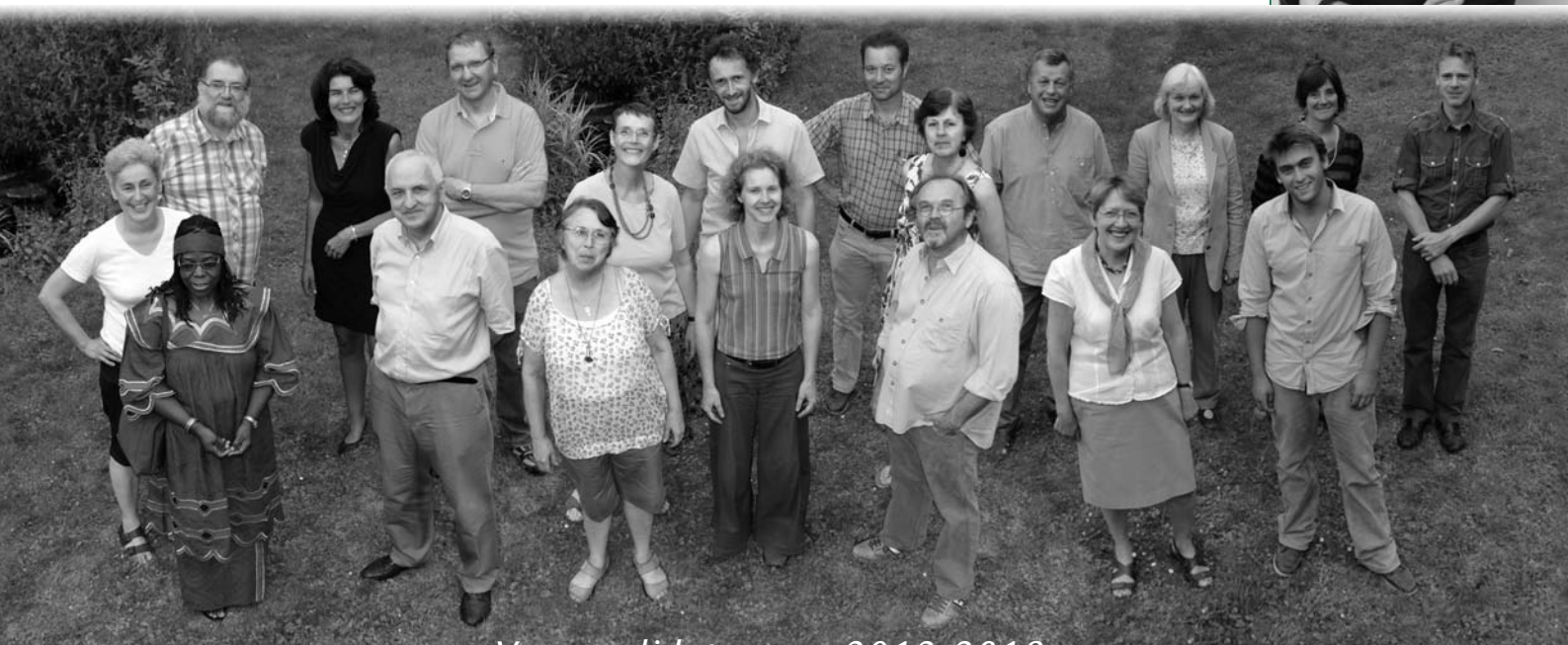
Vos candidats pour 2012-2018